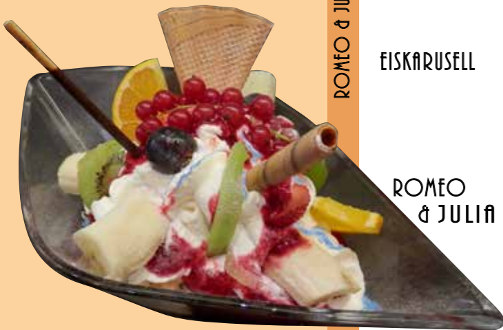
ROMEO & JULIA

EISKARUSELL (für 2 bis 4 Personen) pro Person € 10,20 verschiedenes Eis, hausgemachte Saucen und Liköre, frische Früchte und Schlagobers