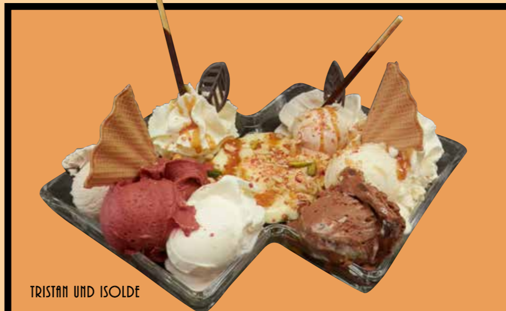
TRISTAN UND ISOLDE