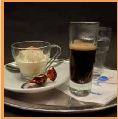
AFFOGATO AL CAFFÈ